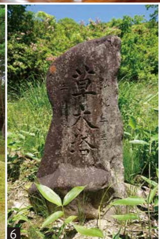
1 마을 정립(町立) 도서관에 있는 책 나무. 독자들 부터 받은 이노우에 히사시의 저서가 꽂혀 있다 2 헤세이22(2010)년에 돌아가셨다. 이노우에 히사시를 추모하는 문학기(忌)「키리키리 기(忌)」 3 각 신사에서도 각각 사자의 웅장한 춤이 봉납되고 있다 4 어린 아이들이 제등 행렬이 있고「옷세 옷세 옷세」를 외치면서 누비는「신을 배웅하는 행사」 5 야마가타현 지정 무형 민속 문화재「코마즈 호넨시시 오도 리(사자춤)」. 춤중에서는 꽃꽂이 쓴 6명의 처녀들의 북과 피리와 노래의 유려한 음색을 뽐내며 춤춘다. 둥근 불길은 아기 사자가 납치돼 미처버린 암사자의 모습을 표현. 둥근 불길속을 빠져나가는 사자는 전국에서도 드물다