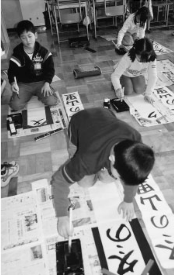
「冬の山里」イメージがふくらむ