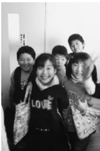
子どもの笑顔は、地域の宝

教育委員会が掲げる小学校2校、中学校1校については、地域の思いや当面する課題なども多く あり、一朝一夕には実現するものではない。しかし、これからの学校は「新たな学校」になってゆくのである。未来を人間らしく生きるための新しい力を生み出していく所である。 未来の子供のため十分な議論を経ての決断が望まれる。