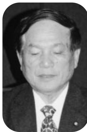
淀 秀夫 議員

淀 自然に恵まれた本町、三年前に環境基本条例を制定し環境保全への施策として第一条から第二〇条をもって構成されている。特に第二〇条には町長は、町民及び事業者に対して必要な指導又は助言を行う事が出来るとなっている。