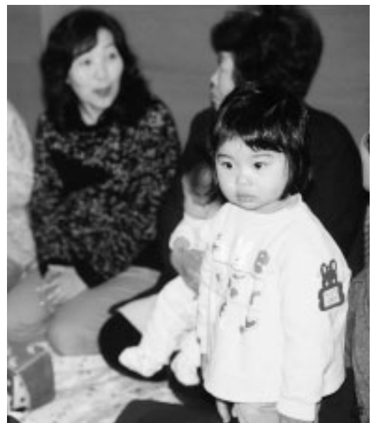
確かに未来を見る目だ

昔は子供は「神仏からの授かりもの。」ところが今は「作ったもの所有物」と勘違いしているから虐待し、殺しても平気な世の中になっているのではと胸が痛みます。また、最近子供達の自殺も連日報道されていますが、自殺を考えた時思い止めたのが「じいちゃん、ばあちゃんの悲しむ姿」だと聞いた事がある。祖母の役目は大切なんだと確信しました。子育ては両親、家族、地域一丸と