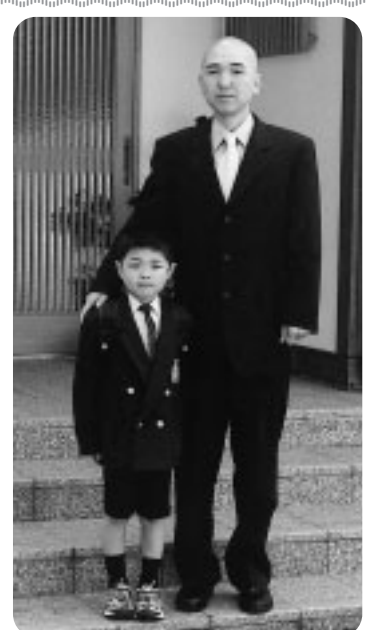
議会広報モニターから一言(5)