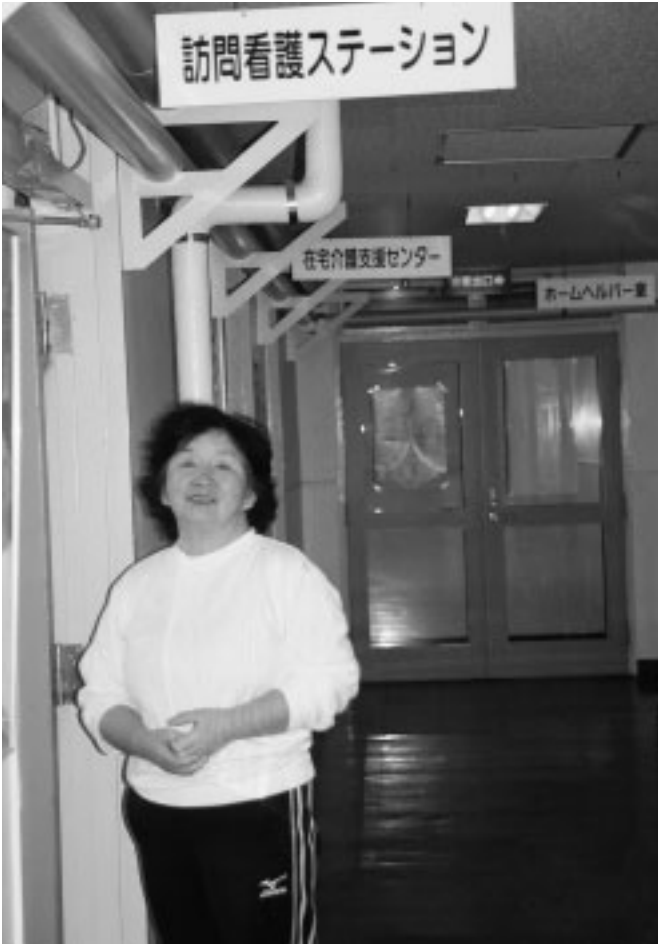
長らくご苦労さまでした