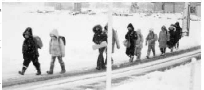
「オハヨウゴザイマス！」

平成十八年十月二十四日～二十六日の三日間、農業振興と商業活性化について愛知県弥富市、静岡県新居町への先進地調査を行った。 弥富市における農地、水、環境保全向上対策事業の取組みは、モデル地区指定を契機に役所ありきでなく地域通貨エコ カードを導入し、資源保全活動に参加した住民にエコカードを渡しカードと地元農産物を交換できる地域通貨制度である。活動を通じ資源保全への理解を高め、地産地消を図る一躍になっていた。参加者から上々の評判を得てるとのことであった。新居町の取組みは、商業