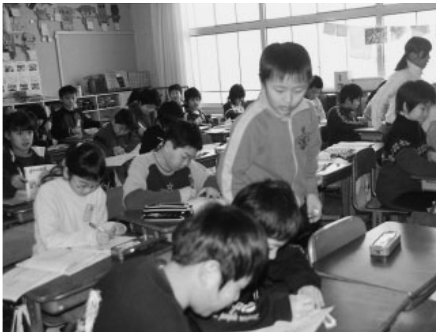
3学期スタート 未来への夢はさまざま