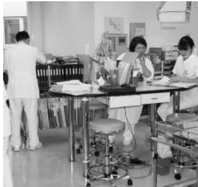
スタッフ不足で需要増に対応しきれない

厚生常任委員会に審査が付託された三つの陳情書がいずれも承認され、三本の意見書が発議された。これらは、先の通常国会で成立した『医療制度改革関連法案』に対するもので、医療と福祉に直接関与する地方議会からの反論というべきものである。いずれも全会一致で賛成。国会・政府に提出された。