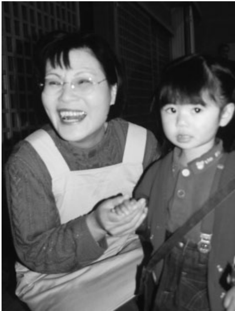
「サポーターのおばあちゃん」といっしょ

地域みんなで楽しく有意義な子育てをしてみませんか！ダリアが川西町を輝かせている様にこの町で子供を育てる事が出来て良かったと思えたら最高です。