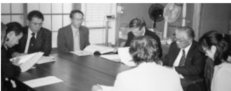
たんぼハウスで説明を受ける

平成十八年十一月二十八日、町の心身障害者の小規模作業所たんぼハウスの運営状況と、介護保険制度改正に伴う介護サービスの現状の二つの現地調査を行った。 まず、平成九年に開所したたんぼハウスでは、十五人がボールペンの軸揃えなどの作業に、働くことの誇りを持って楽しく仕事をしていた。 運営費の収入は、主に町、県の補助金それに事業収入など。今年度は法律改正により国の補助金がカットされ、六九五万円の前算を組んでいるものの、運営は非常に厳しいとのこと。 平成十二年からスタートした介護保険制度は、今年度、一部改正された。町の社会福祉協議会に所属する訪問ヘルパーは十七人、ケアマネージャー二人。 月平均の介護利用者は六十人前後、のべ利用回数が一六二五回と平成 十七年度の実績でしたが、今年度はそれを上回るようだ。 今後、国の方針として居宅介護を含めた居宅サービスの充実が求められている。