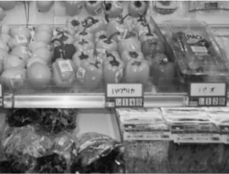
海外産農産物はけっしてめづらしくはないが