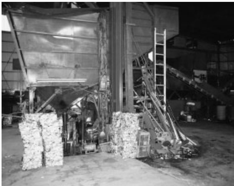
「産廃中間施設」資源再利用は重要なテーマだが

条例作成までの当局側の法令審査委員会はどのような審査が行われるか。 町長 条例案の検討は解釈や文章表現等を審査し、町の政策として適当であるか審議し提案を議会にはかる。 淀 かつて、空き缶等のポイ捨て条例や町並みづ