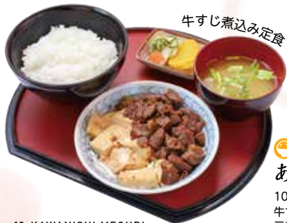
牛すじ煮込み定食

☺☺☺☺☺ ☺川西町大字大舟988-4 ☎0238-33-3977 ☺土・日11:00～16:00 (L.O.15:30) (16:00完全閉店) ※営業日・時間・メニュー等につきましては都度変更となる可能性もございます。 SNS・HPにて最新情報のご確認をお願いいたします。 ☺年末年始、お盆、その他