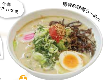
豚骨辛味噌らーめん

☺☺☺☺☺ ☺川西町大字上小松1647-1 ☎0238-42-3927 ☺11:00～14:00 (L.O.13:30)、17:00～23:00 (L.O.22:30) ☺日曜日 ※ご予約があれば営業いたします。 ※ランチ営業日はお問合せください。