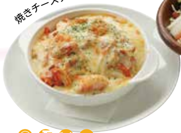
焼きチーズナポリタン風