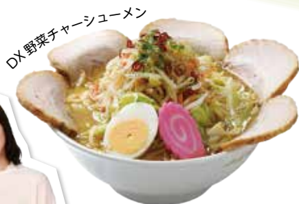
DX 野菜チャーシューメン