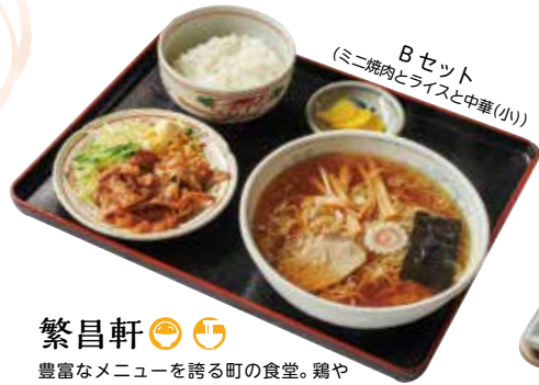
Bセット (ミニ焼肉とライスと中華(小))

☺☺☺☺☺ ☺川西町大字上小松1578 1F ☎070-1303-4939 ☺11:30～17:00、19:00～24:00 ☺日曜日