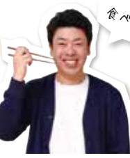
全部食べたいなあ