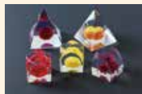
クリスタルダリヤ