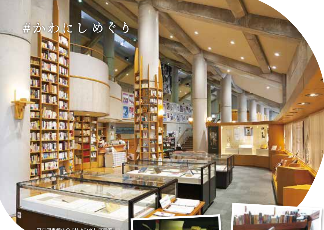
町立図書館内の「井上ひさし展示室」