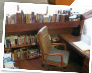
井上ひさしの書斎を再現

昭和62年、井上ひさし氏から町に寄贈された蔵書をもとに「遅筆堂文庫」が開館、現在は約22万点が所蔵されています。本の至るところに残された同氏の書込み、付箋からは作家の息遣いが伝わってきます。令和6年4月には、遅筆堂文庫内に鎌倉にある同氏の書斎を再現した「井上ひさしの書斎」がオープンしました。