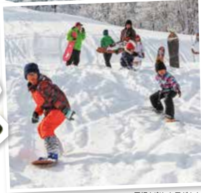
雪板を楽しむ子どもたち