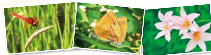
ハッチョウトンボ