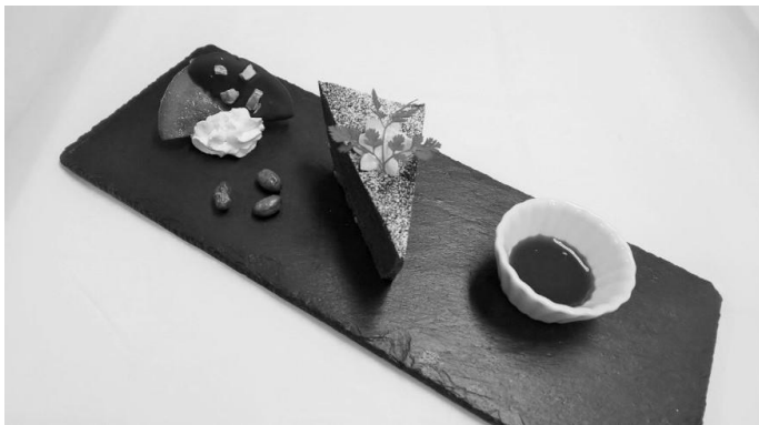
自家製ガトーショコラ

ほかにも、コロナ禍であるからこそ時間を有効に活用すべく、様々な形で従業員研修を行っています。例えば、従業員が改めて川西町を知り、お客様に多様な情報をお届けできるような歴史の学習や、従業員自身がまどかに宿泊しながらサービスを体験し客観的にまどかを見ることで改善点を見つけるなど、お客様サービスの向上に向けて多方面に目を向け挑戦しています。