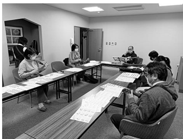
→ウクレレ体験の様子

現在、まどかでは、これまで多くの方にご利用いただいた温泉・お食事のほかに様々な体験ができる施設を目指し多様な取り組みを実施しています。例えば、お食事と一緒に楽しむことができるウクレレ体験。ウクレレレッスンを楽しんだ後は、まどか自慢のお食事やスイーツが堪能できる、まどかならではのイベントとなっています。