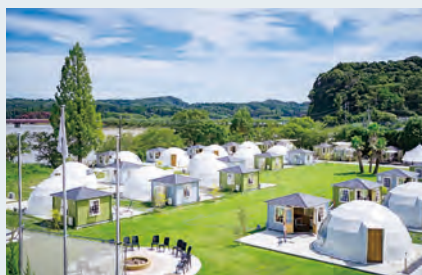
グランピング施設の整備