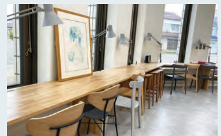
コワーキングスペースの整備