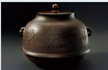
伝統工芸品の制作