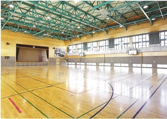
屋内運動場(体育館) ※全面での貸出です