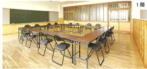
第1会議室 / 机、椅子式(口の字形式) / 定員20名程度