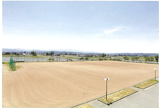
屋外運動場(グラウンド) ※半分、又は全部の貸出です