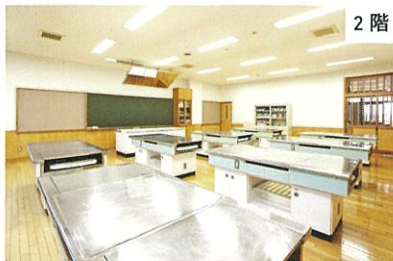
調理室 ※椅子は準備していません