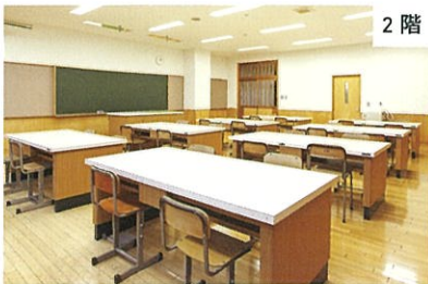
集会室 / 4人掛け机 / 定員32名程度