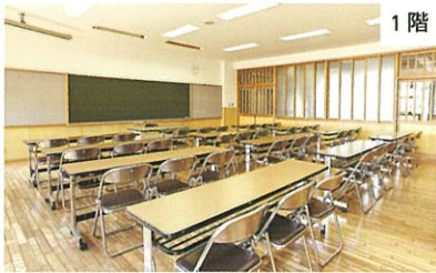
第2会議室 / 机・椅子式(3名掛け机形式) / 定員35名程度