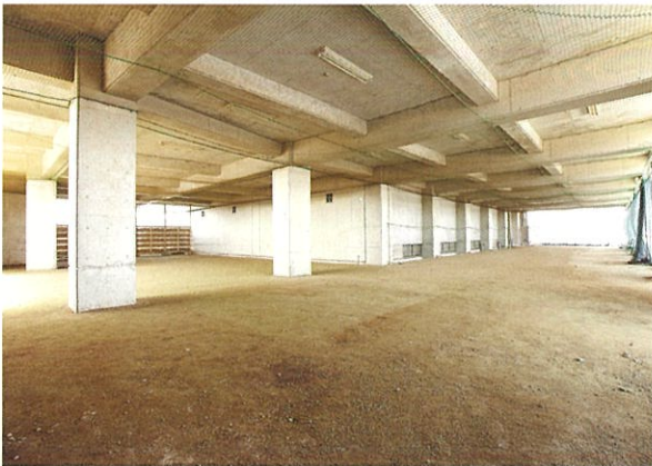
ピロティ(体育館1階部分) ※全面での貸出です

※競技用の設備備品は利用者をご準備ください。 ※使用に際しては来館のうえ使用条件を確認してください。