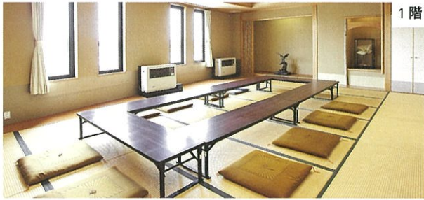
和会議室 / 座卓式 / 定員15名程度