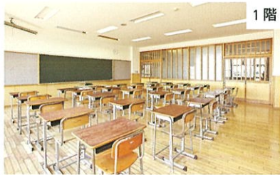
第3会議室 / 机・椅子式(スクール机・椅子形式) / 定員30名程度